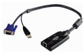
USB电脑端模块 KA7170 x 200