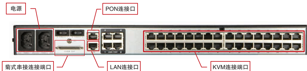
· KM0532 后视图