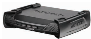
PS/2-USB控制端模块 KA7230 x 5